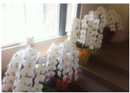
沢山のお花やお酒を頂きました、ありがとうございます。