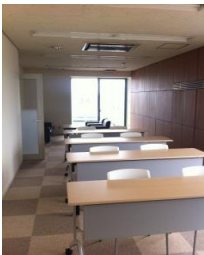
セミナーも開けそうです。

でも、本当に 新事務所は広くてゆっくりして頂けると ころです。お近くにお越しの際は、ぜひお立ち寄り下さい。おいしい カプチーノ をご用意してお待ちしております。