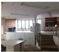
事務所内にも階段が…オシャレになりました。