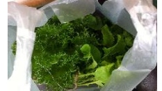
たくさんお土産を頂いてしまいました…