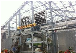
毎週火曜日には栽培されている野菜の購入が出来ます。