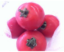
水耕栽培で作られたトマトです。本当に甘かったです。

おいしくて安心なトマトをいただきました！！水耕栽培なので、土を使わずばい菌や病気も少ない為、農薬も使わない、そんなトマトです。お味は・・・めっちゃくちゃ甘い！酸味が少なく 果肉が多い、得した気分になる トマトです。3~4個入って、お値段、なんと、100円！！本当に得した気分になりました。