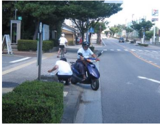
【笑顔】ポロシャツ着用で