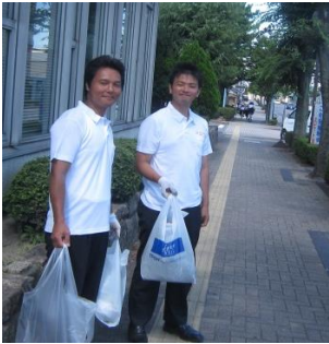
お二人ともいい笑顔です