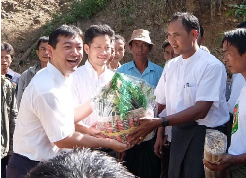
↑村の方から大歓迎を受ける社長♪

こんにちは♪寒くなってきて、どんどん冬が進んでますがお願いだから雪だけは降らないでほしい・・・と願っている大家です。