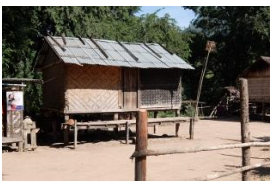
村の電源はこの発電機→

現地には配線むき出しの電柱が立っていたり、夜間は時間を決めて発電機を動かしているらしく、「ジェネックスに出来る事がきっと沢山ある！！」と感じたそうです。 ※詳しくはホームページの【初blog 初ミャンマー初めまして】に載ってます！！宜しければのぞいてみて下さい♪